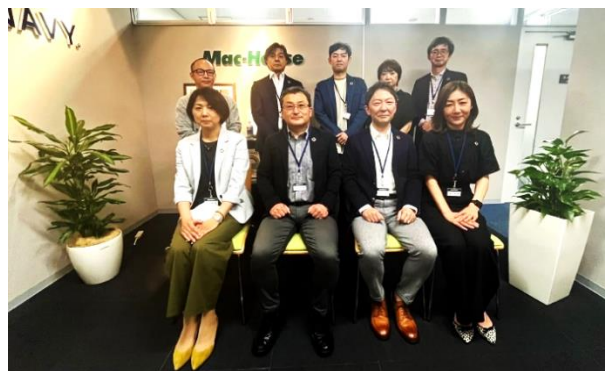
各部署代表者で構成されるサステナブル推進委員会。実務者を中心に選出し、情報共有や意見交換を行い、業務に反映します。（定例会議：年3回）